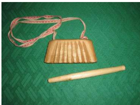
Рубель- ударный инструмент