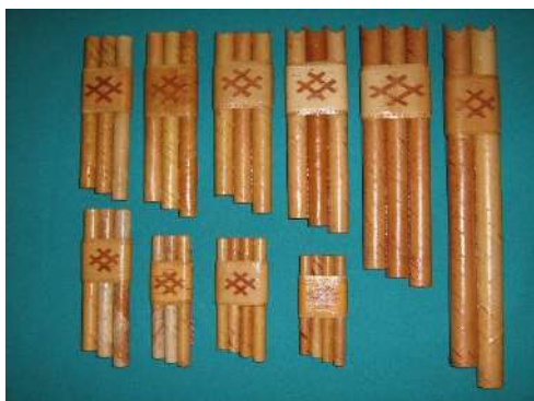
Куима чипсан – трехствольный свисток