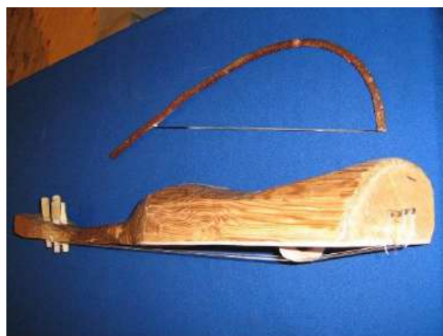
Сигудок – струнный инструмент