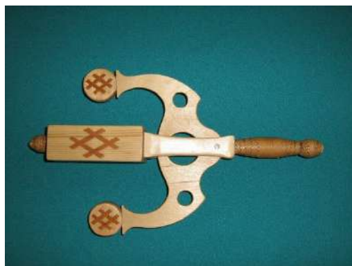
Тодшкодчан - колотушка