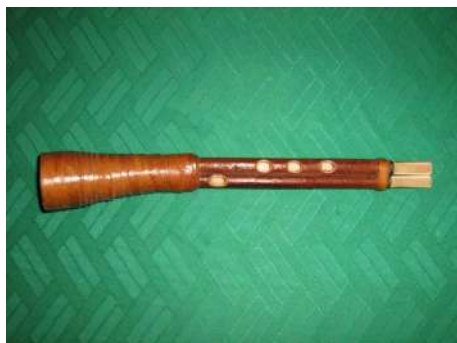
Гум полян – дудка одноствольная