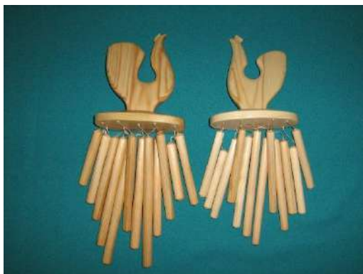
Зиль Зэль – шумовой инструмент