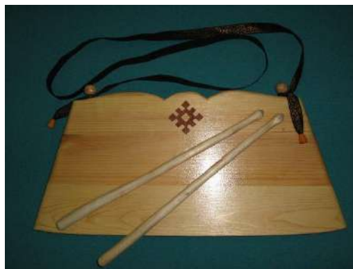
Пу барабан – деревянный барабан